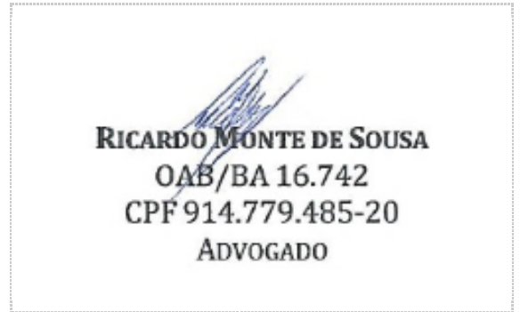
Assinatura de Ricardo Monte de Sousa

ZapSign Token: a2289b3e-****-****-****-d8eb66d5383b