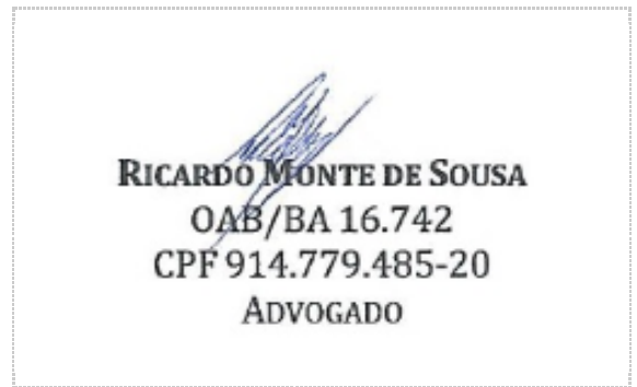
Assinatura de Ricardo Monte de Sousa

ZapSign Token: a2289b3e-****-****-****-d8eb66d5383b